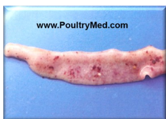
E. maxima lesions