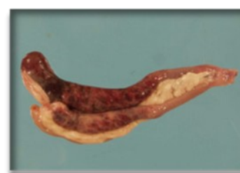
Photo : coccidiose caecale à Eimeria