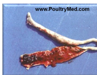
E. tenella lesions