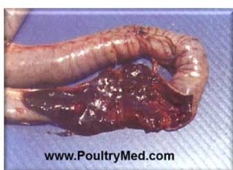
E. necatrix lesions